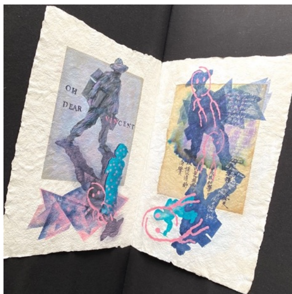
“Oh, Dear Vincent,” single fold folio with stenciled and painted images, page from an antique Chinese handwritten manuscript, handwritten and stamped text.

《親愛なるヴァンセントよ》二つ折りのフォリオにステンシルと絵、中国の手書き古文書の頁、手書きとハンコ文字