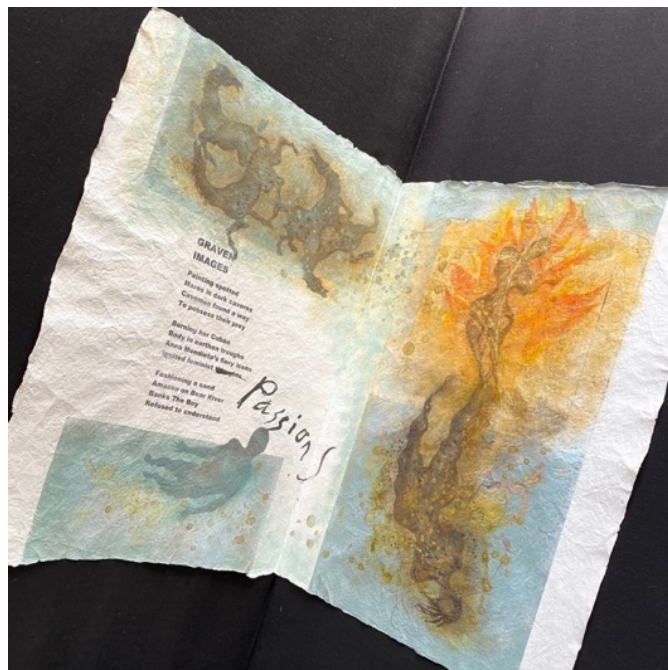
Graven Images & Passions: Remembering Ana Mendieta A folio from the Bear Suite

《彫像と情熱：アナ・メンディエタを偲んで》 熊川の組曲のフォリオ（二つ折のアート作品）