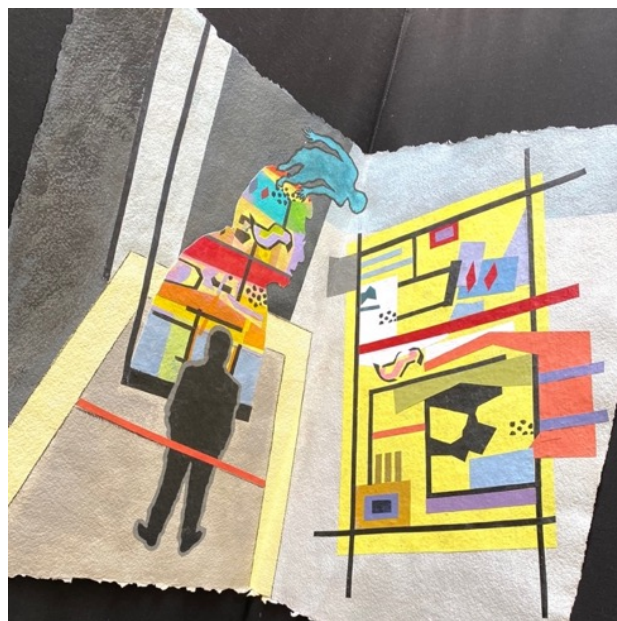
Remembering For Internal Use Only (2021), collaged acrylic painting on Shizen watercolor paper, 23 x 30 ½ inches.