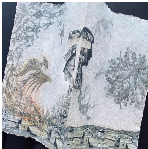
Three-fold folios in the series “Phoenix & Mermaid in the City of the Dead” 同作品群《死の町の不死鳥と人魚》の三つ折りのフォリオ