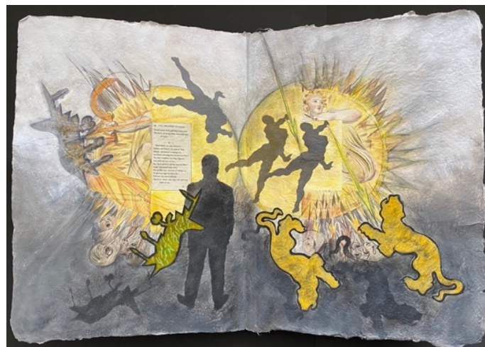
"I Witness Hyperion's Battle with Tygers & TygerJetPlanes" 《虎とタイガージェットと共にハイペリオンの戦いを見る私》