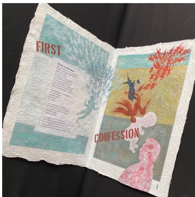
“Before Birth,” folio # 1 of 12 《出生前》全12枚のうち1枚目のフォリオ

Before Birth I : the first version of this set of twelve folios, is in the Special Collections of the Merrill-Cazier Library at the Utah State University and was displayed at the Springville Museum of Art exhibition titled “Roots & Branches,” June 13-November 30, 2018. Before Birth II is a promised gift to the Church Historical Museum in Salt Lake City Utah.