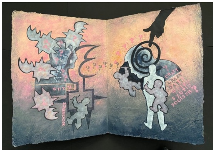
What Crazy Man Would Photograph Children's Wall Drawings? 《壁の子供の落書きを写真に撮るのは、一体どんな気違い男?》

Four single-fold folios (2020-2021)) made from collaged images and acrylic painting and some with hand-written and stamped text on Lokta paper, each folio measures approximately 19 x 27 ½ inches.