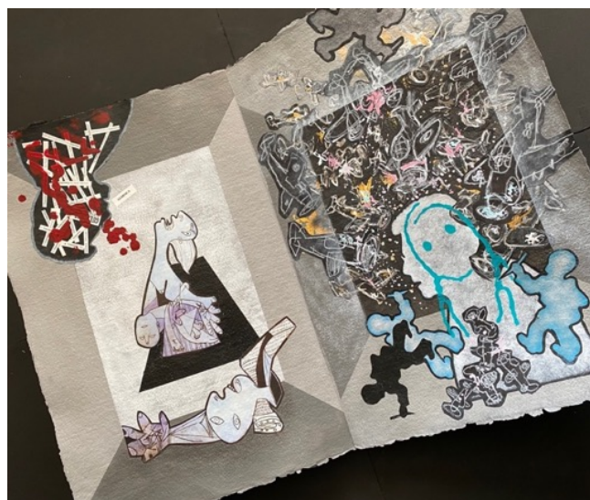
"Picasso's Guernica & Memories of World War II, Fought on the Blackboard @ Fairview Idaho Grade School"

《ピカソのゲルニカと第二次世界大戦の記憶：黒板での戦い。アイダホのフェアビュー小学校にて》