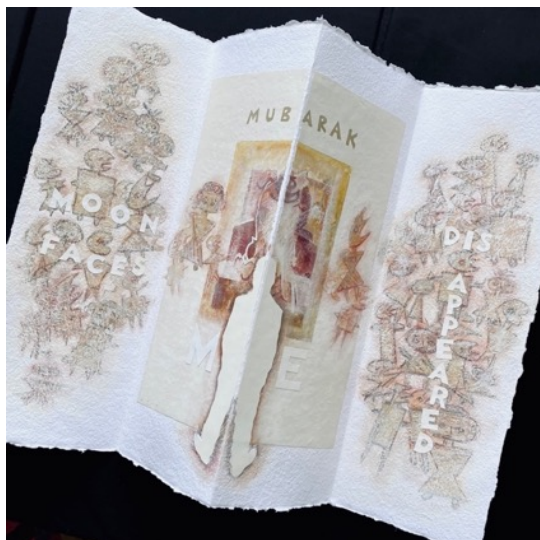
“Did the Makers of MoonFaces Make Mubarak Disappear Twice?” 《ムバラクを二度消えさせたのは Makers of MoonFaces》

Four three-fold folios (2022) composed of small acrylic painting on paper made in Cairo in 1982 and collaged on Shizen watercolor paper with additional collaged images, hand-written, hand-cut and stenciled text. Each folio measures approximately 23 x 30 ½ inches